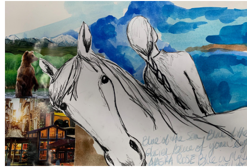
Ejemplo de una obra de arte completa de Alter Ego por Rosanne Sammis, profesora de artes visuales en The Benjamin School, 2020.

¿Hay algo más que te preguntes sobre esta obra de arte?